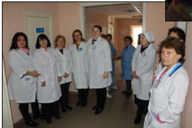
Administrația IMSP Centrul de sănătate Dubăsari

nie, se sărbătorește Ziua lucrătorului medical și a farmacistului.