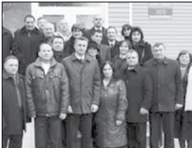
Cu respect, Colectivul IMSP SZ AMU „Centru”

Cu prilejul Zilei lucrătorului medical și a farmacistului, colectivul IMSP Stația Zonală de Asistență Medicală Urgentă „Centru” Vă adresează cele mai sincere și cordiale urări de sănătate. Fie ca activitatea Dumneavoastră plină de abnegație, pasiune, dăruire de sine și profesionalism să Vă asigure permanent meritatul confort social și o ambianță creatoare scaldată în valurile Perfecțiunii și încălzită de liniștea sufletească și sentimentul datoriei împlinite, pe care mărinimos le dăruim celor ce au nevoie de cea mai de preț valoare a Umanității – Sănătatea. Să fiți mereu în topul faptelor frumoase, prospere și onorabile, iar florile stimei, aprecierii și recunoștinței să rămână mereu proaspete în sufletele și inimile Dumneavoastră.