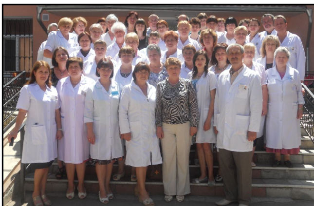
Centrele de Sănătate Autonome din raionul Soroca

Cu ocazia sărbătorii profesionale „Ziua lucrătorului medical și farmacistului” colectivele CMF Soroca și Centrelor de Sănătate Autonome din raionul Soroca Vă adresează sincere felicitări și doleanțe de sănătate, împliniri pe plan personal și profesional, prosperitate, bucurii de la cei dragi, multă răbdare membrilor familiilor Dumneavoastră, să aveți parte de căldura recunoștinței umane și a satisfacției morale, să fiți mereu în avangarda fortificării sănătății populației.